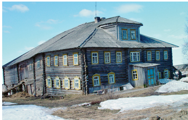
Дом Бутиных в д. Столетовской (Павлова). Фото 2008 г.

«Административной» деревней можно назвать д. Гавриловскую (Рубцову) . Традиционно она является единственной деревней, расположенной на главной дороге. Из описания Пудожского тракта конца XIX в.: «...до первой и единственной на дороге деревни, Лядинской волости, Рубцова, Гавриловской тож. За нею, немного в стороне, направо от дороги, стоят две деревянные церкви Лядинского прихода... видны версты за 4 (почти от самого ручья Сахара)... обнесены кругом деревянной же, бревенчатой оградой. Приход этот так же древен, как и Печниковский, и почти так же в нем развит раскол...» 16 Рубцова – самая крупная лядинская деревня. В ее центре, на повороте дороги, стояла часовня Св. Власия; разобрана в середине XX в. С середины