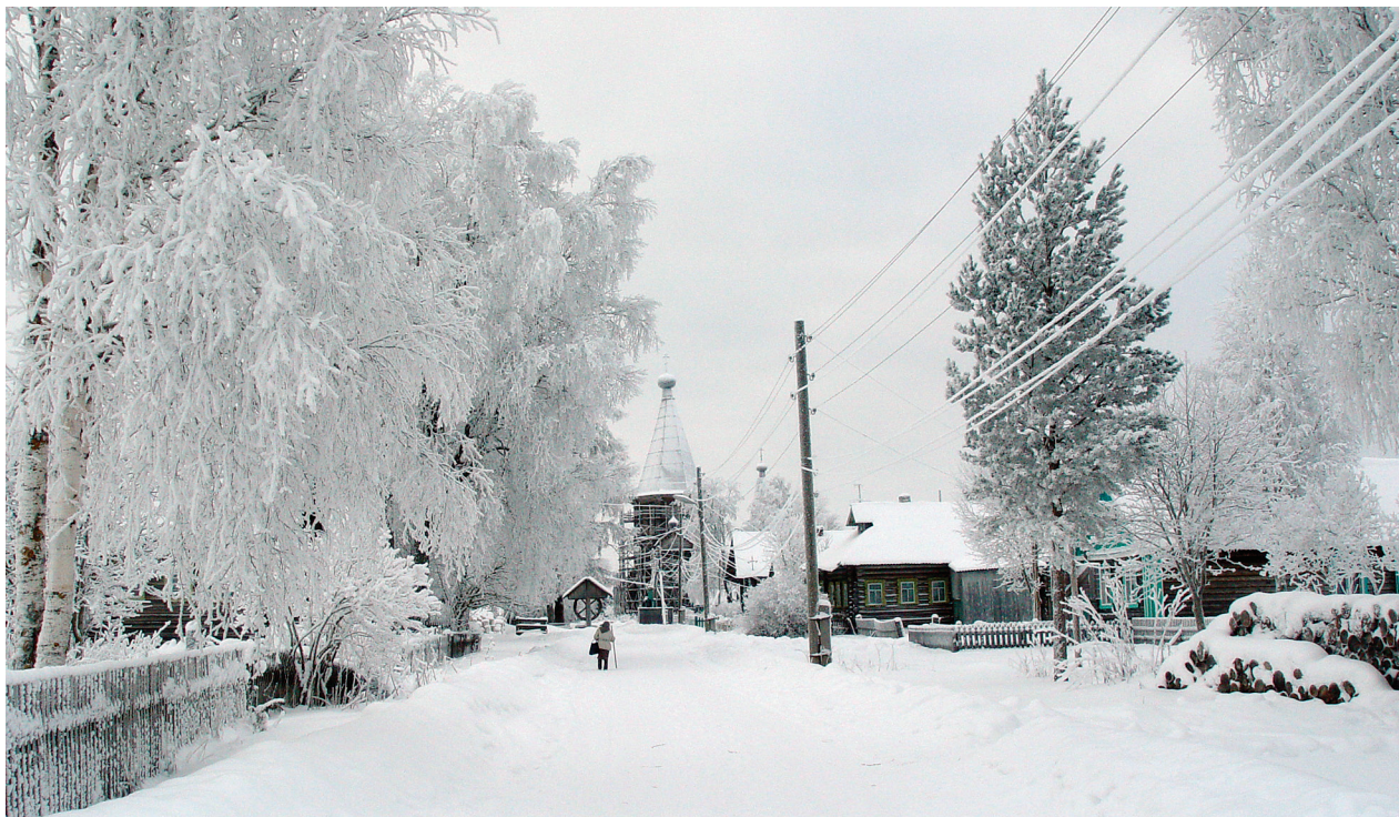
Деревня Дудкинская (Дьякова). Фото 2010 г.

Самым почитаемым и широко отмечаемым праздником в Лядинах был Покров. Праздничной