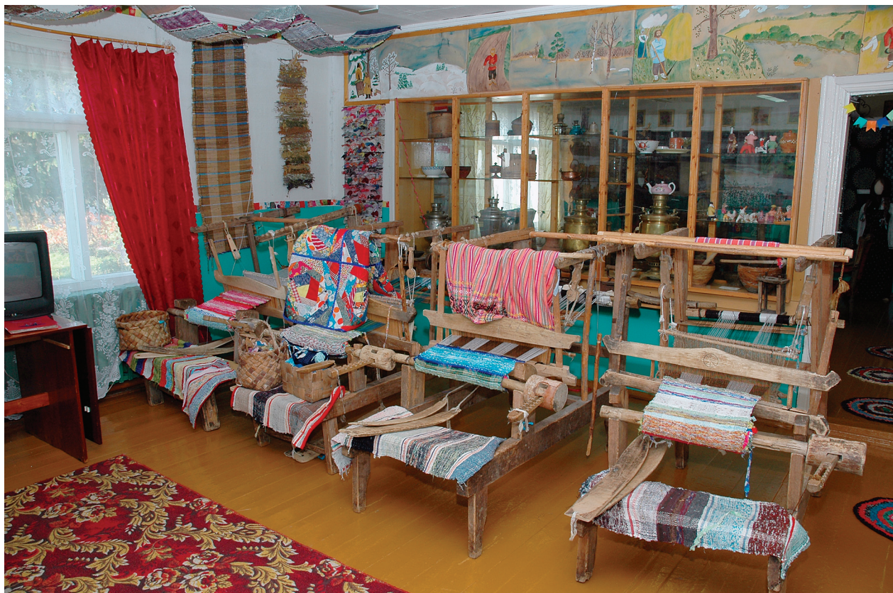
Школьный музей в Лядинах. Фото 2007 г.

службой в Покровской церкви отмечался этот праздник. К этому времени сельскохозяйственные работы были завершены. Как говорили, во дворах не хватало места лошадям. После тяжелой уборочной страды люди были рады отдыху, общению и на празднике предавались всеобщему веселью. У стен ограды Лядинского погоста открывалась праздничная ярмарка.