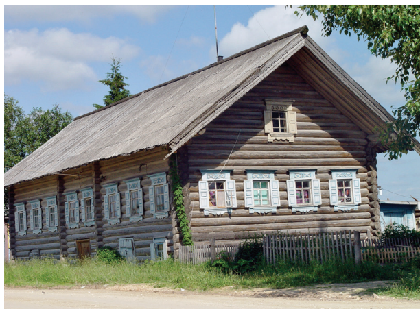
Дом в д. Гавриловской (Рубцова). Фото 2007 г.