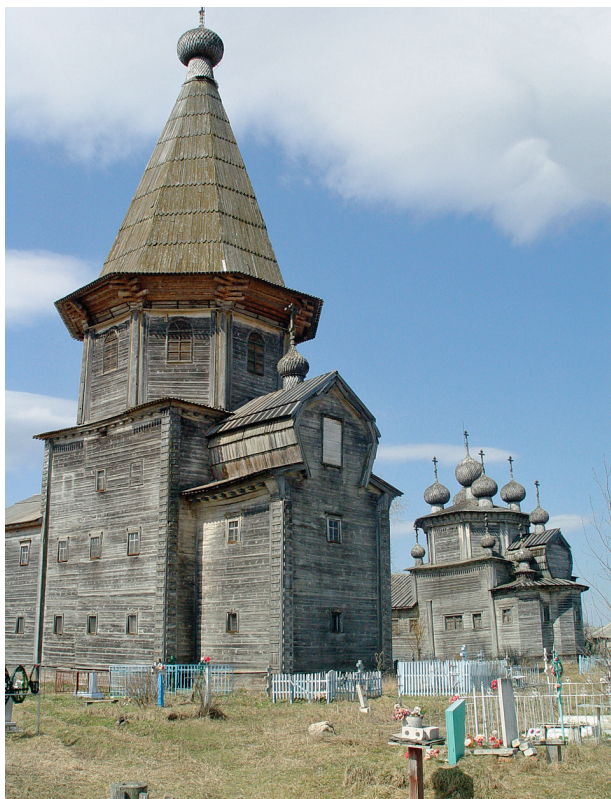
Покровская и Богоявленская церкви. Фото 2005 г.

зодчестве типу двухэтажной шатровой церкви «восьмерик на четверике с трапезной», представляет собой высокий двухэтажный четверик, на котором покоится восьмерик, увенчанный высоким шатром. С западной стороны – двухэтажная трапезная. С востока – алтарный прируб, увенчанный бочкой. Покрово-Власьевская (так ее еще называли) церковь поражает своими размерами – это величавые хоромы. Срубить такую махину могли только мастера, вооруженные многовековым опытом (ее высота 42 м). Особенно величав шатер храма, едва ли не самый большой среди сохранившихся шатровых сооружений Каргополья. Храм огромен, но громадность его не давит, он соизмерим с человеком. «Интерьеры церкви также значительны. Внизу находилась Власьевская зимняя церковь с трапезной – сумрачное помещение с приземистым потолком. Верхнее помещение Покровской церкви более просторное, облегченное. Как в верхней трапезной, так и в нижней мощный брус потолочной матицы поддерживается двумя резными столбами традиционной формы в виде поставленных друг на друга дынок с перехватами в виде жгутов. Вдоль стен тянутся лавки с