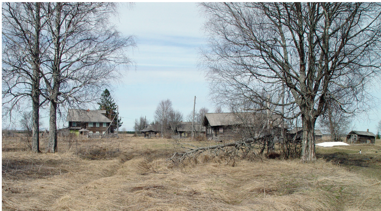
Деревня Киселёвская. Фото 2008 г.

Столетовская – Половниковы, Дьяковы, Старцевы, Терёшины, Бу́тины, Малышovy, Поповы; Гавриловская – Ба́бкины, Бородулины, Дьяковы, Коровины, Зайцевы, Евдокимовы, Сухоруковы, Симановы, Поголёнкины, Бородулины, Микишины; Дудкинская – Абаку́мовы, Сальниковы, Старцевы, Часовенные; Фоминская – Тонких, Сальниковы, Митины; Киселёвская – Калинины, Рудако́вы, Вешняко́вы, Митины, Макаровы; Антоновская – Бутины, Никитины, Терёшины; Мелентьевская – Ромшины, Вешняковы, Бутины, Басовы.