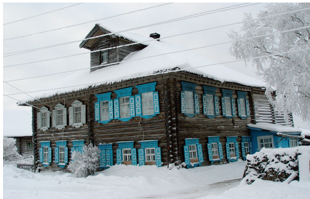
Дом Сухоруковых в д. Гавриловской (Рубцовой). Построен в 1920-е гг. Фото 2010 г.

Основная дорога – Пудожский тракт, но на расстоянии 7–10 км от деревни существовало много лесных дорог, по которым ездили на лошадях, т. к. в округе деревень разрабатывались полосы под пашню (а к месту пашни надо ехать с сохой, бороной и т. д.). Заготавливали лес, сенокосили, собирали грибы и ягоды.