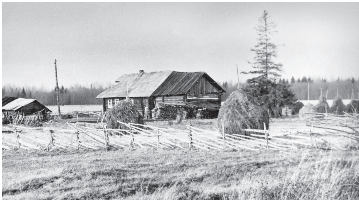
Лядинская деревня. 1970-е гг.