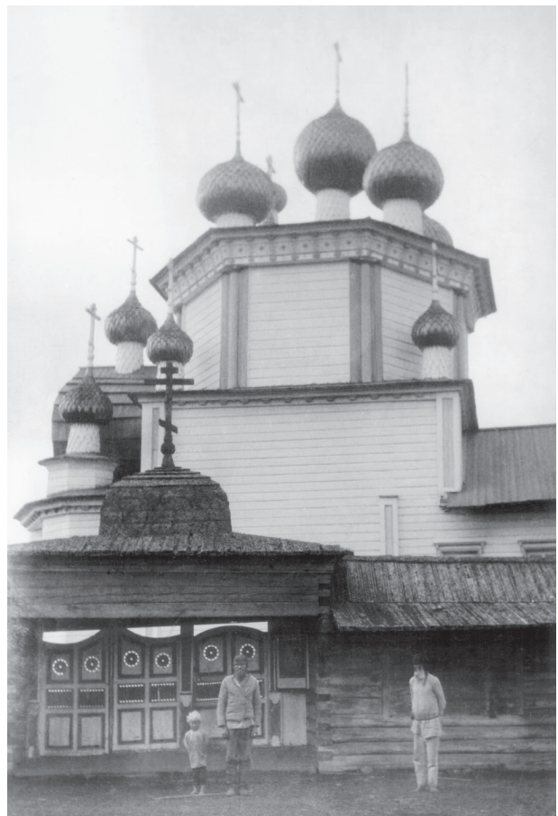
Богоявленская церковь и ограда Лядинского погоста. Фото начала XX в.

Лядинские храмы, несмотря на все потрясения XX в., сохранились. Поэтому существует достаточное количество описаний архитектурных особенностей этих церквей. Главный храм Лядинского погоста – летняя шатровая Покровская церковь – относится к редкому в деревянном