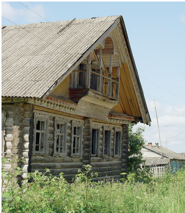
Старое здание почты. Фото 2007 г.

На реке Лекима было построено и работало 4 мельницы, которые назывались: Камень, Ярыга, Ропотуха, Сколиха. На речке Сахар было построено три мельницы: Середняя, Сахар и Кобыляк. Молоть зерно на муку приезжали в Лядины с Кучепалды, Печниково и др. деревень.