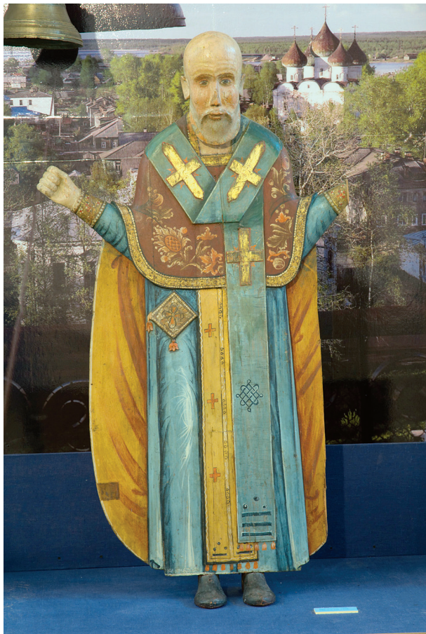
Никола Можайский, XVIII в. Скульптура из Никольской часовни в д. Киселёвской. Фото 2010 г. Каргопольский музей, КП 7348