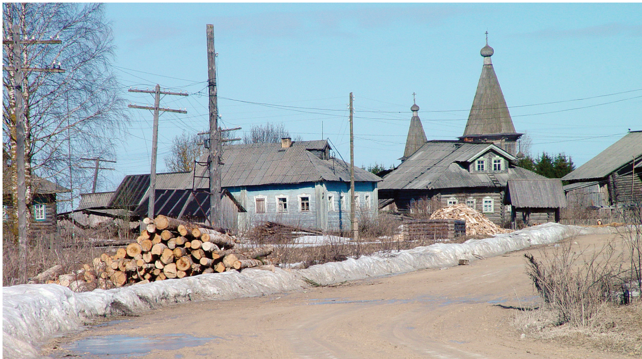
Деревня Гавриловская (Рубцова). Фото 2008 г.