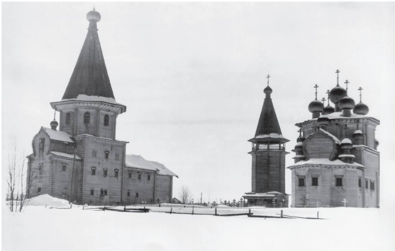
Лядинский погост. Фото начала XX в.

лет сохранять административную обособленность. Лядинские деревни составляли одно сельское общество Лядинской волости. Вероятнее всего, причиной этого послужила ее удаленность. Соседними волостями были Красная Ляга, Печниково, Лекшмозеро, и также общались с Ягремой, Тихманьгой, Лихой Шалгой.