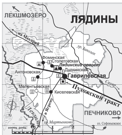
Схема Лядинской волости

Лядинской волости, несмотря на небольшое число деревень, удалось на протяжении почти 50