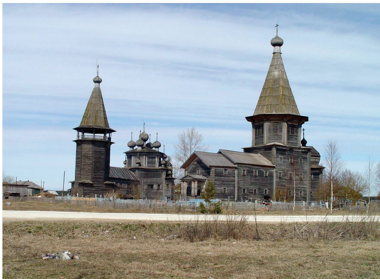
Лядинский погост. Фото Д. Тормосова, 2004 г.