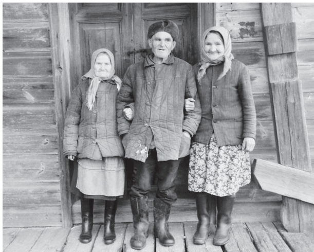
Жители д. Киселёвской на крыльце Никольской часовни.