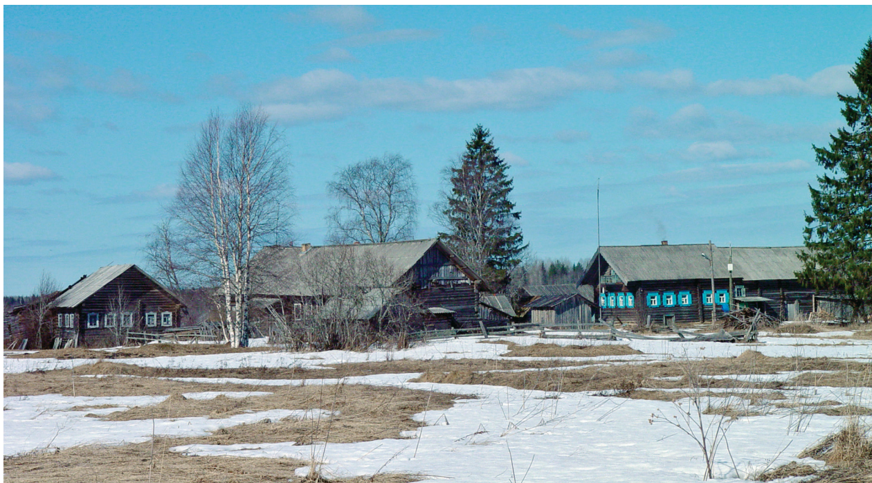
Деревня Фоминская (Фомин конец). Фото 2008 г.